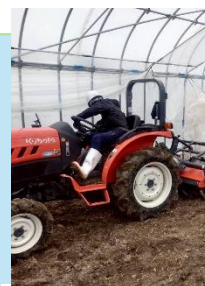
実習（トラクター作業）